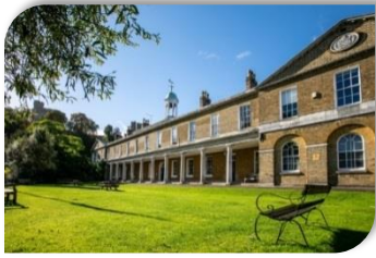
St George's School Windsor Castle

Adventure Lego Robotics Minecraft Coding Learn to Swim Tennis Academy Wildlife