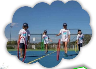
Ejemplo de horario