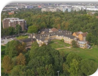
St Augustine's Priory