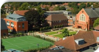
King's College School