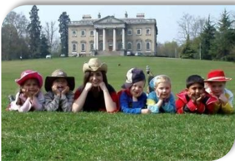
Claremont Fan Court School