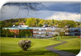
Croydon High School