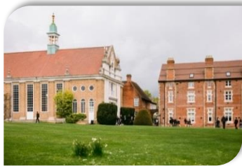
Bishop's Stortford College